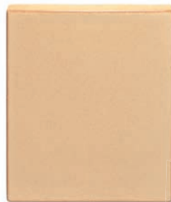
ZA - 22 - 25 Záklop 22x25