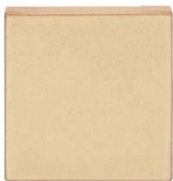
ZA - C Záklop 22x22