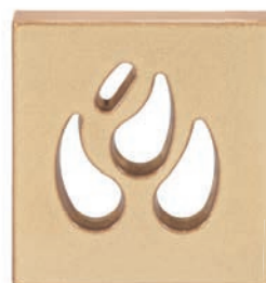
ZA - C - V4 Záklop větrací - plamen