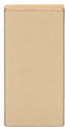
ZA - P Záklop 11x22