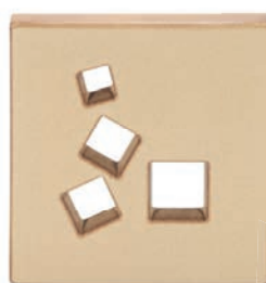
ZA - C - V3 Záklop větrací - čtverce