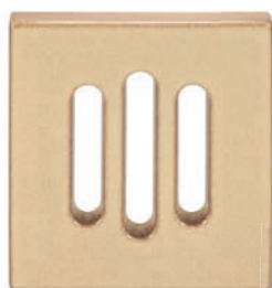
ZA - C - V2 Záklop větrací - nepravidelná drážka