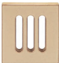
ZA - C - V1 Záklop větrací - pravidelná drážka