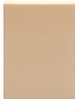
ZA - 22 - 28 Záklop 22x28