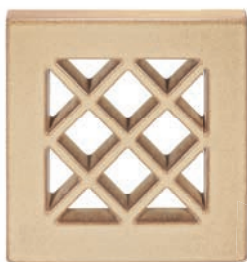
ZA - C - V5 Záklop větrací - mřížka