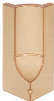
RS - K - R0,2 - 28 Roh půl půl 28 - koncový