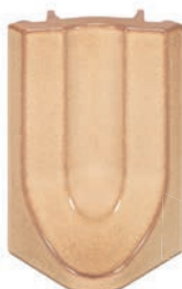
RP - K - R4 - 22 Roh půl půl 22 - koncový