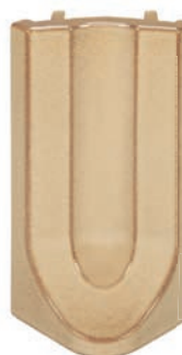
RP - K - R4 - 28 Roh půl půl 28 - koncový