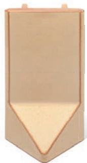
RV - K - R1 - 28 Roh půl půl 28 - koncový