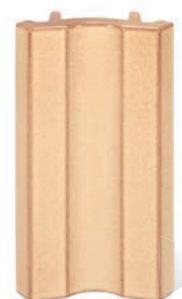
RP - P - R4 - 28 Roh půl půl 28 - průběžný