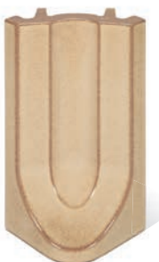
RP - K - R4 - 25 Roh půl půl 25 - koncový