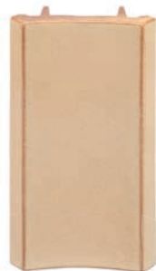
RL - P - R4 - 28 Roh půl půl 28 - průběžný