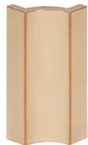
RS - P - R0,2 - 28 Roh půl půl 28 - průběžný