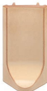
RL - K - R4 - 28 Roh půl půl 28 - koncový