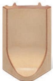
RL - K - R4 - 22 Roh půl půl 22 - koncový