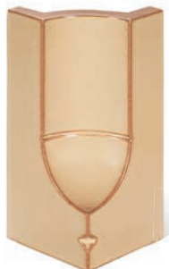
RS - K - R0,2 - 25 Roh půl půl 25 - koncový