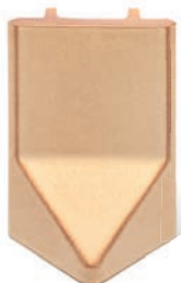
RV - K - R1 - 22 Roh půl půl 22 - koncový