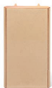
RV - P - R1 - 28 Roh půl půl 28 - průběžný