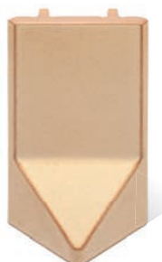
RV - K - R1 - 25 Roh půl půl 25 - koncový