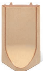
RL - K - R4 - 25 Roh půl půl 25 - koncový