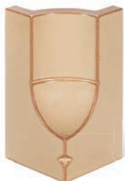
RS - K - R0,2 - 22 Roh půl půl 22 - koncový